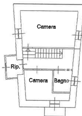
Pianta piano secondo